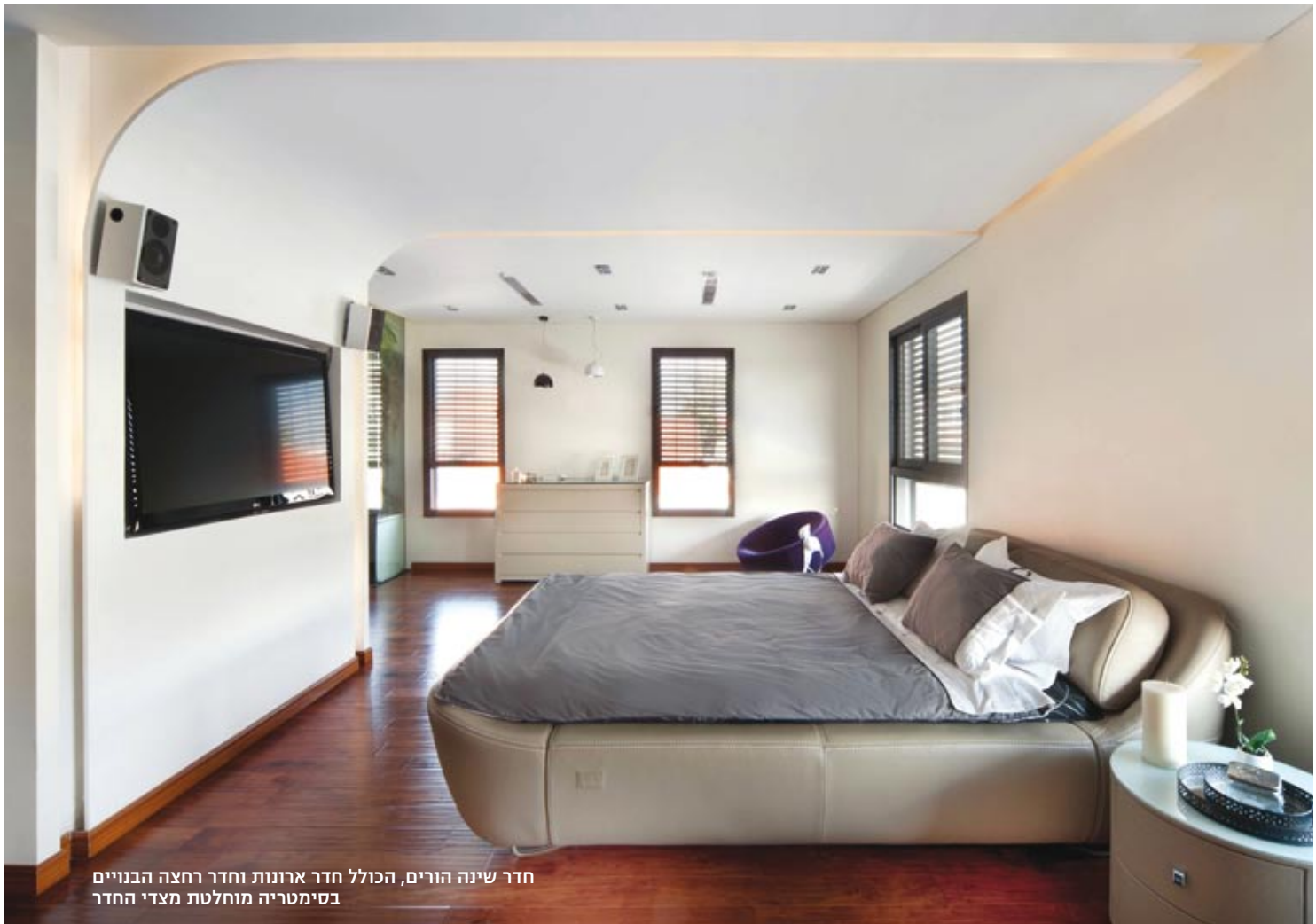
חדר שינה הורים, הכולל חדר ארונות וחדר רחצה הבנויים בסימטריה מוחלטת מצדי החדר