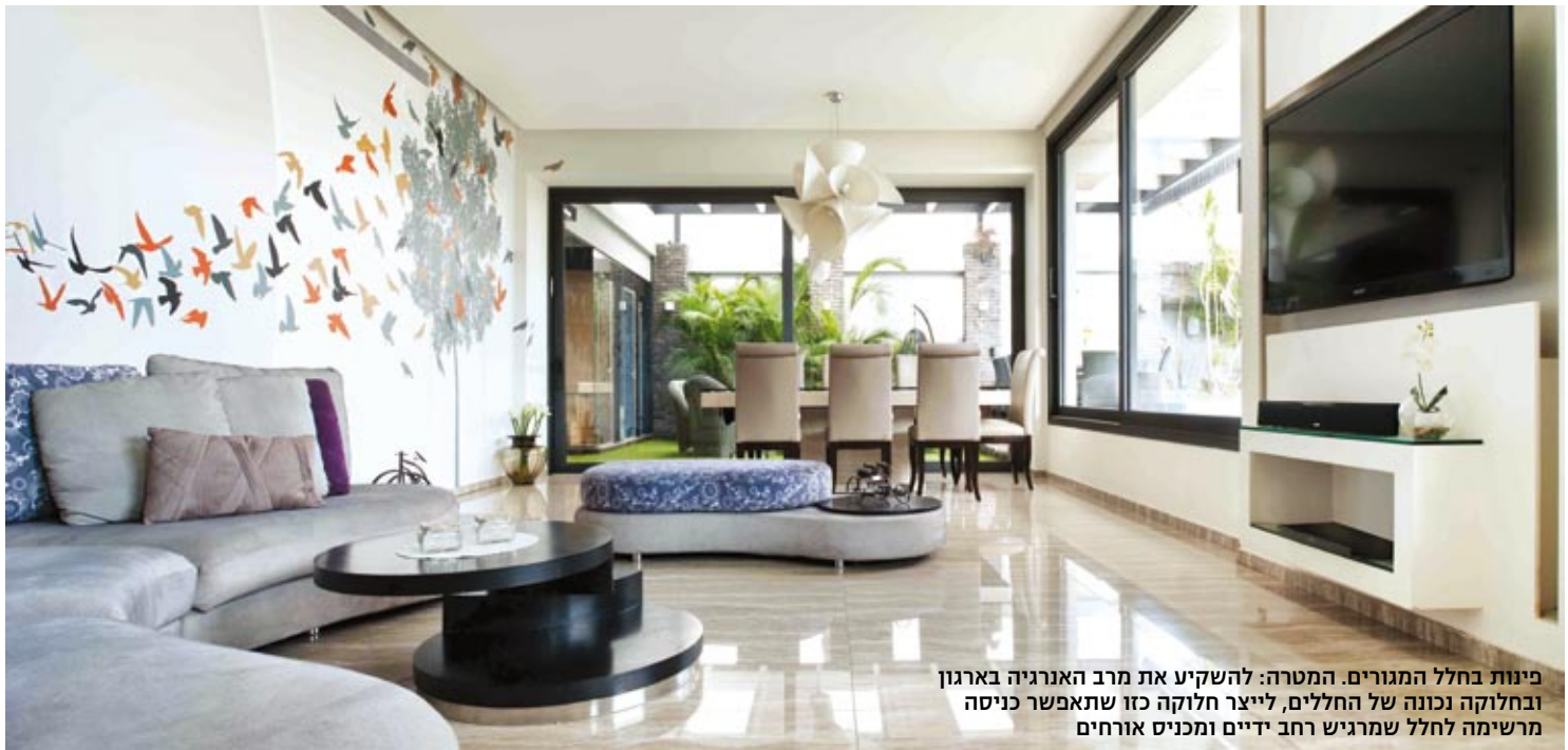
פינות בחלל המגורים. המטרה: להשקיע את מרב האנרגיה בארגון ובחלוקה נכונה של החללים, לייצר חלוקה כזו שתאפשר כניסה מרשימה לחלל שמרגיש רחב ידיים ומכניס אורחים