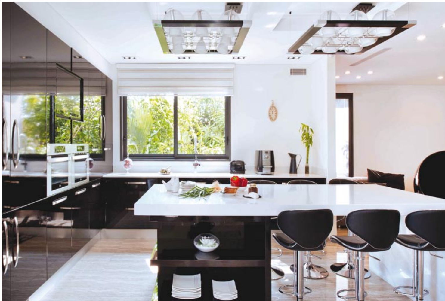
בזכות אהבת הבישול והאירוח: מבטים אל המטבח